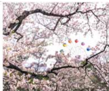
「春の観覧車」 浜松市中区 澤木眞七郎