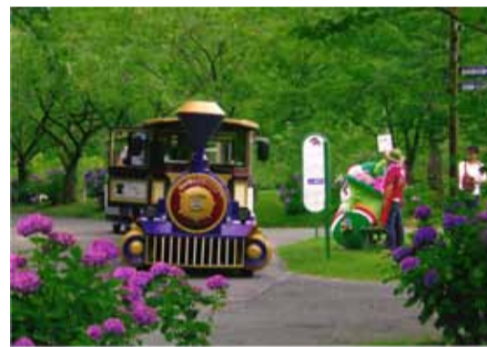
「こんにちは、ふらまるです」 浜松市天竜区 森下保