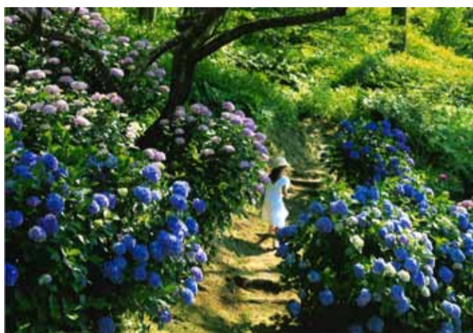
「紫陽花と少女」 浜松市北区 松浦嘉人