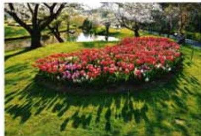
「せいくらべ」 浜松市中区 高橋祥吉