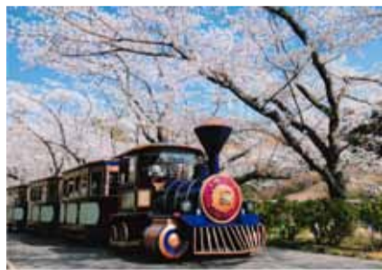
「桜のトンネル」 浜松市中区 井田雄治