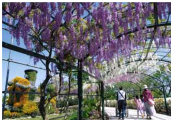
「藤のアーチを散策」 浜松市中区 今田弘