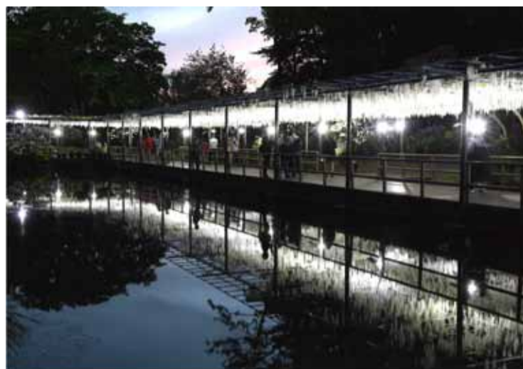
「夕暮れの白藤」 浜松市東区 渡辺洋二