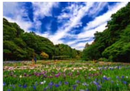
「菖蒲園に湧き立つ雲」 浜松市中区 稲垣成憲