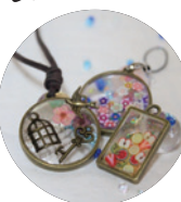
レジンアクセサリ