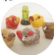
木目込みの干支(亥)