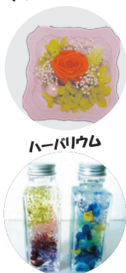
プリザーブドフラワー ハーバリウム