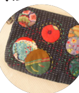
久留米緋のバック